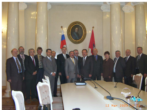
Besuch der Bayerischen Delegation am 12.3.2003 im Rathaus in Moskau