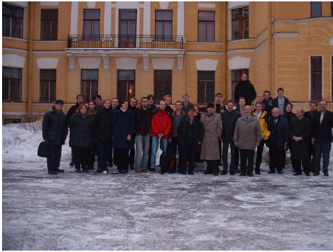
Teilnehmer der ersten Deutsch-Russischen Student School 2003 in St. Petersburg vor dem Euler-Institut