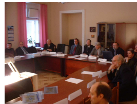
Besprechung beim "Runden Tisch"

Solch intensive und tiefe Kontakte und Diskussionen ohne Zeitdruck zwischen deutschen und russischen Studenten und Professoren sind wahrscheinlich nur bei solchen Veranstaltungen möglich, wie schon die Ferienakademie im Sarntal über viele Jahre gezeigt hat. Es war am Ende allen Beteiligten klar, dass diese Idee ausgebaut und weitergeführt werden muss und wir denken sogar daran, in naher Zukunft diese Idee auch nach Moskau zu tragen, wo auch gute Kontakte bereits bestehen.